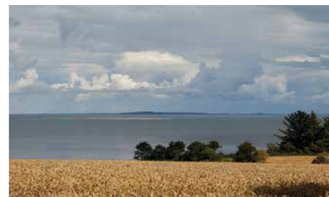
Udsigt fra Alsted Kirke mod Dråby Vig og Buksør Odde